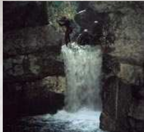
Rapel n.º 8 Barranc de l'Infern, abril 2004.

Son varias las posibilidades para dejar el coche, ya que las distancias de aproximación y retorno no son muy grandes. Si llevamos sólo un coche lo dejaremos nada más cruzar el pueblo en una calle ancha y sin casas. Desde aquí tomaremos un camino asfaltado muy estrecho, que sale con dirección a la Peña de Los Cuervos