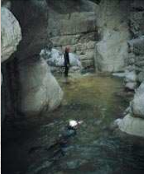
Barranc de l'Infern, abril 2004.

cuentado por la necesidad de utilizar dos coches si no queremos andar demasiado. Aconsejable y relativamente bien equipado.