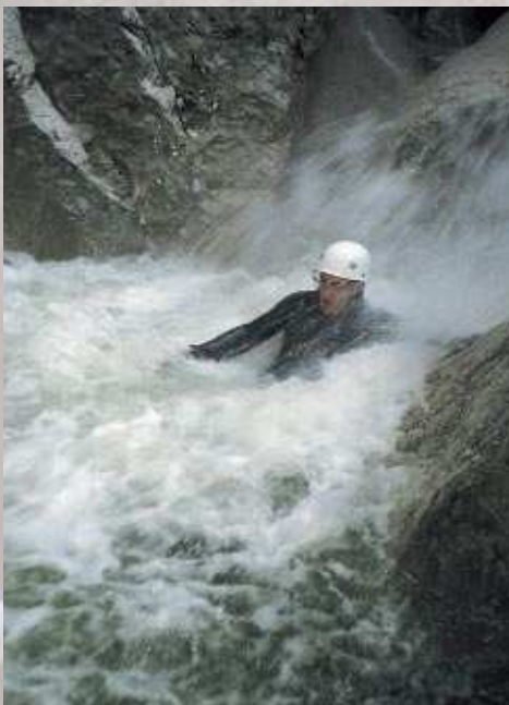
Resaltes acuáticos en el Barranc de Mela con fuerte crecida. Marzo 2003.

El barranco, en su parte acuática, no precisa la utilización de croquis para su realización. Hay únicamente un rápel de 5 metros al comienzo, no saltable, con un spit a la derecha para rapelar (pero que puede salvarse rodeando por la derecha un peñasco y bajando de nuevo hasta el cauce). Después de salir de la parte con más vegetación entramos en una parte más estrecha donde encontraremos verdadero ambiente acuático con sus badinas y pozas todas saltables pero que requerirán en algunos casos de su revisión previa. Algún salto es algo técnico y requiere de experiencia, así que cui-