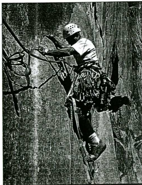
Necesitaron seis días para coronar la cumbre.